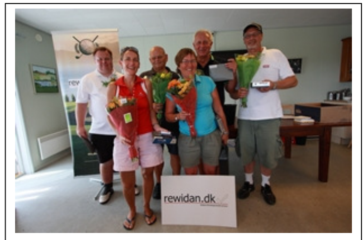
Sidste års glade vindere, i A-rækken og i B-rækken